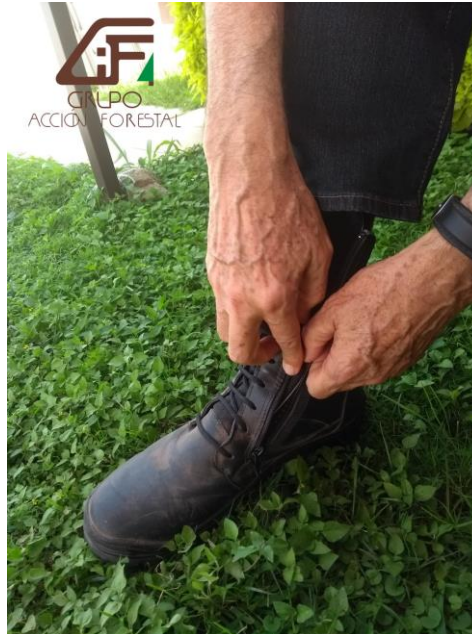
Acomode su bota