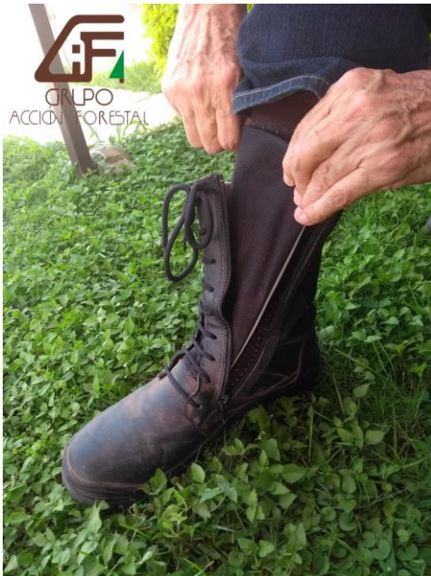
Ajuste la lengüeta

Las botas, con uso rudo en selva y monte, mantienen su ajuste con las agujetas. Puede ponerlas y quitarlas cómodamente con el cierre de alta calidad. Excelentes para trabajo pesado en campo.